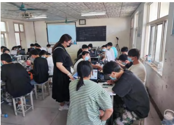
网络创业意识培训

今年全校共组织培训 22 期，上报实名制培训台账 1800 余人次，完成年度培训总量。其中计算机能力提升培训 7 期，共计 1131 人次；网络创业意识（GYB）培训 5 期，共计 269 人次；电子商务培训 6 期，共计 210 人次；创业实施培训 2 期，共计 60 人次；“1+X” WPS 办公应用培训 2 期，共计 65 人。学校依托“机械工业职业技能鉴定站”“南阳市第五中等职业学校职业技能等级认定中心”，针对社区居民、在校学生进行职业技能认定，共计取证 541 人次，其中计算机维修工（中级）337 人，电子商务师（网商中级）67 人，汽车维修工（中级）75 人，“1+X” WPS 办公应用（初级）62 人。