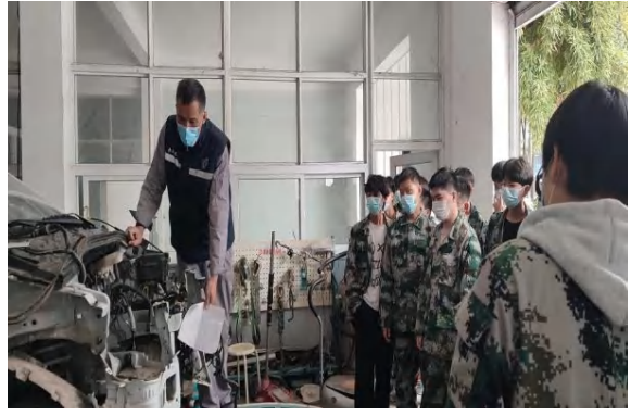
企业技师现场组织教学