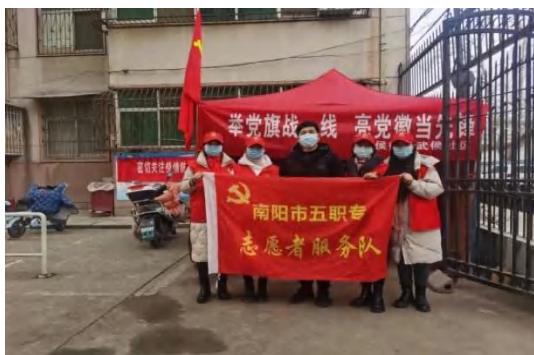
武侯社区疫情防控服务队