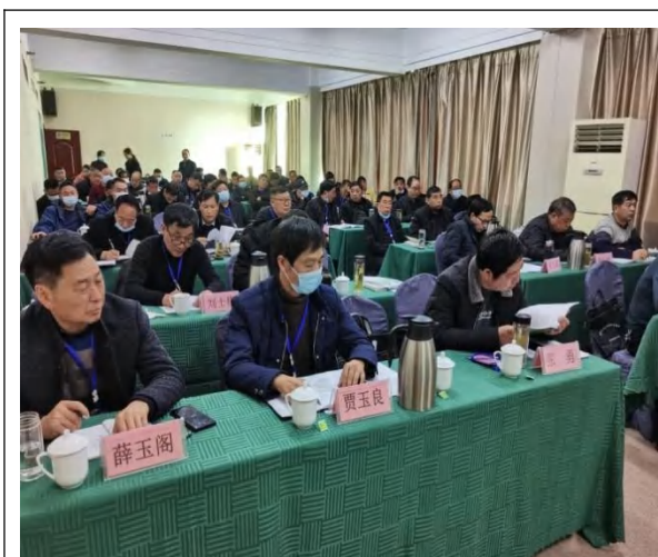
培训学员认真听专家授课