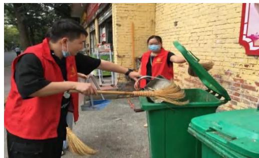
志愿者开展打扫卫生活动