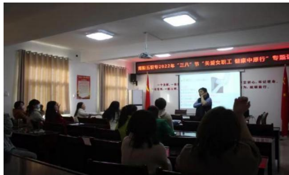
社区妇女健康心理知识讲座