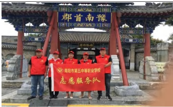
民主街志愿服务队

为贯彻落实南阳市文明办、南阳市供销社志愿服务文件精神，把志愿者服务意识和回报社会理念深入居民，学校成立志愿者服务领导小组及多志志愿者服务队伍，深入社区开展为老服务、清洁社区、交通引导、疫情防控、健康讲座、礼仪讲座等志愿者服务活动，全所共计参加志愿者服务 420 人次。