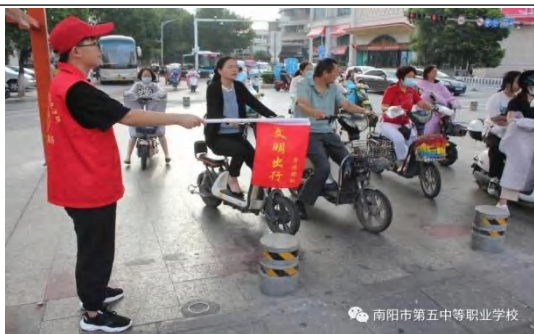
工业路口引导交通