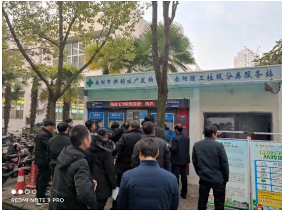
参观南阳市广发公司分拣中心