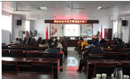
和庄社区开办文明礼仪知识培训讲座