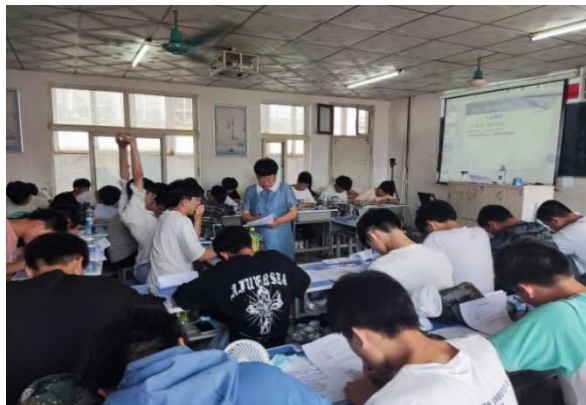
网络创业实施培训