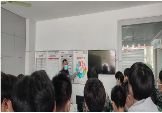
企业技师现场组织教学